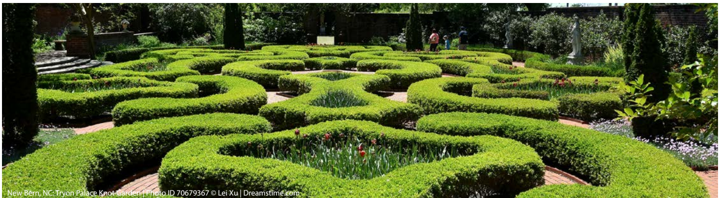
New Bern, NC: Tryon Palace Knot Garden