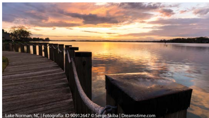
Lake Norman, NC