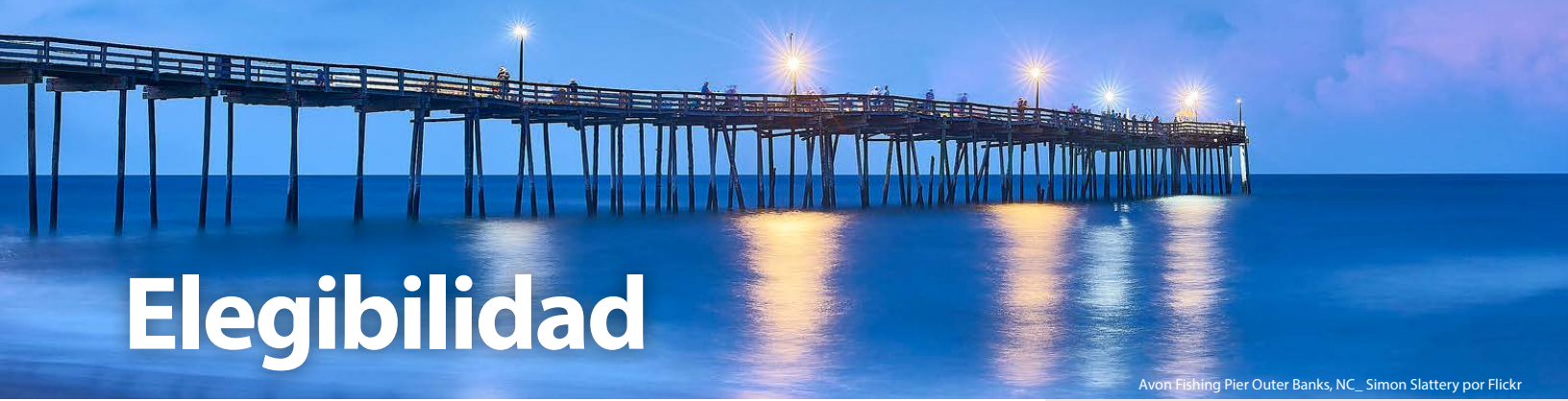
Avon Fishing Pier Outer Banks, NC