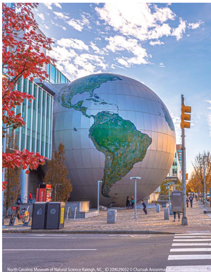
North Carolina Museum of Natural Science Raleigh, NC_ID 209029032

Para obtener más información sobre los planes por discapacidad, incluyendo las exclusiones y limitaciones, vaya a la sección de ncflex.org y seleccione Certificado NCFlex STD o Certificado NCFlex LTD .