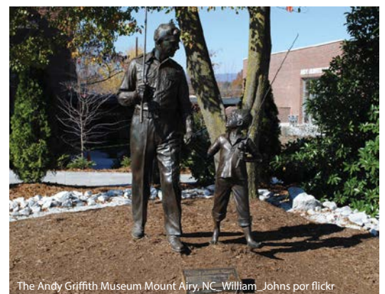
The Andy Griffith Museum Mount Airy, NC