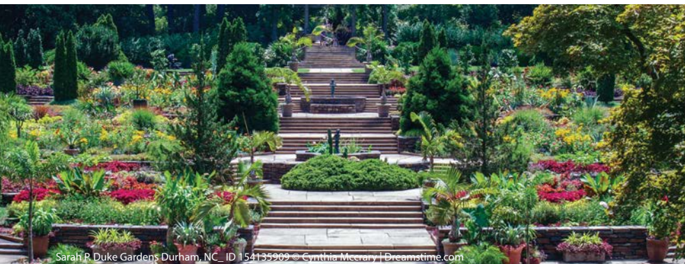
Sarah P. Duke Gardens, Durham, NC

Para comunicarse con EyeMed, llame al 866-248-1939 o visite eyemedvisioncare.com/NCFlex .